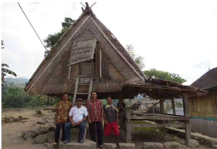
Gambar 5 Uma Leme sebagai wadah penyatuan antarumat

Keunikan yang sangat menarik juga didapatkan di Desa Mbawa, dalam satu rumah – dalam keluarga inti ( nuclear family ), terdapat perbedaan agama dan keyakinan. Bila seorang ayah beragama Khatolik, anak, saudara maupun istri terdapat keyakinan yang berbeda seperti Islam maupun Protestan. Dalam rumah tidak ada pertentangan ataupun kesenjangan antara anak dan orang tua apalagi istri. Anggota keluarga tetap saling menghormati dan menghargai sesuai dengan apa yang dipeluk dan diyakini. Ketika ada urusan keluarga, mereka tetap hadir dan berkumpul. Emosi keagamaan dan keyakinan serta emosi keluarga selalu dibedakan posisinya