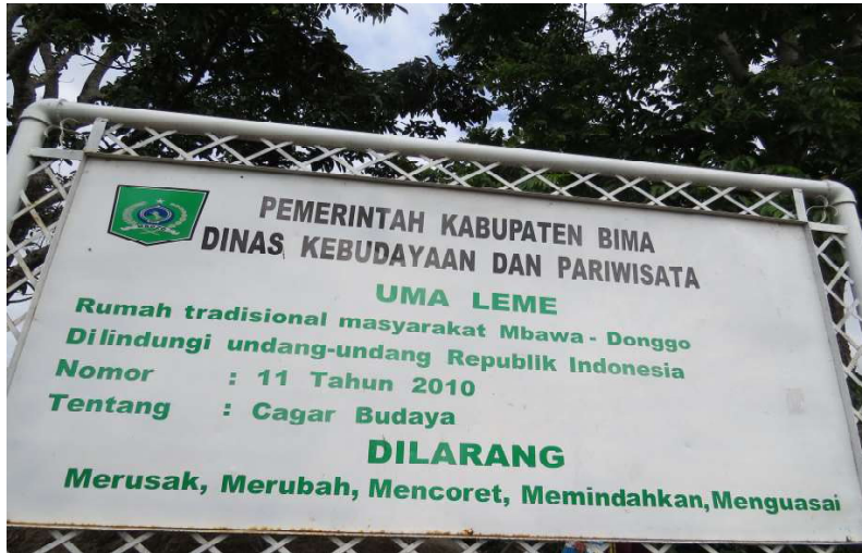
Gambar 4 Bukti pengesahan Uma Leme sebagai Cagar Budaya

karena kedua emosi itu mengajarkan kedamaian dan keharmonisan antarumat manusia. Namun sebaliknya, kedua emosi ini sangat mudah juga diprovokasi untuk membangkitkan sentimen kelompok. Para tokoh agama menyikapi secara arif yaitu dengan cara mengedepankan rasionalitas daripada emosional dalam menyelesaikan suatu masalah.