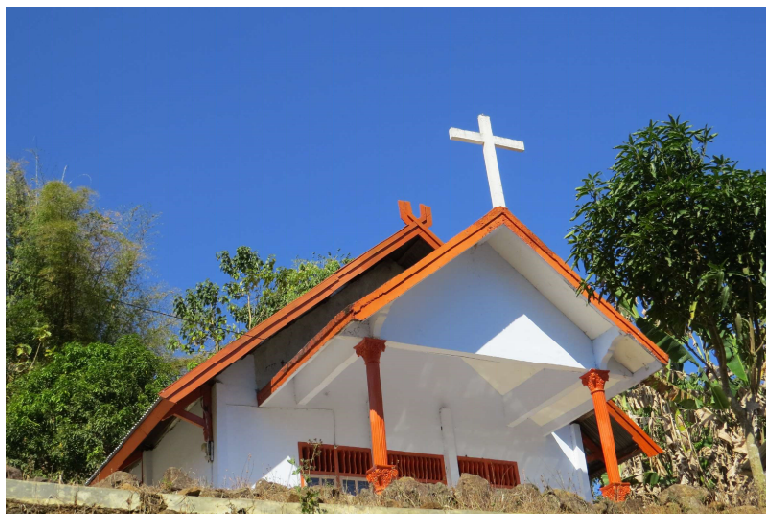
Gambar 3 Gereja Protestan GKII (Kemah Injil)