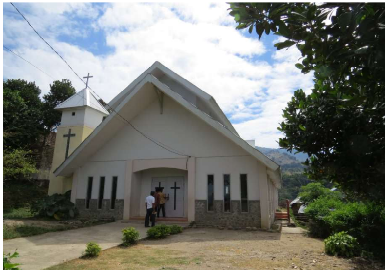
Gambar 2 Gereja Khatolik St. Paulus Mbawa