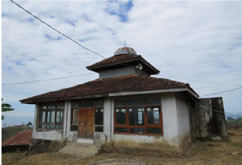
Gambar 1 Masjid Jabal Nur Mbawa