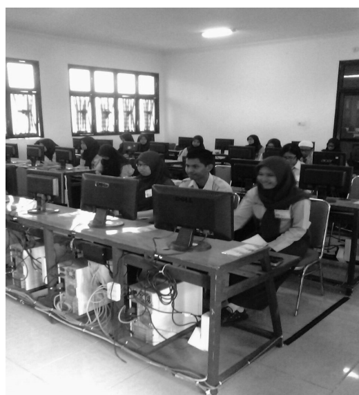
Gambar 1 Pelaksanaan UNBK